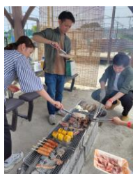
炭の火加減が難しい🔥