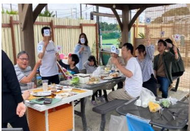
お手製〇×札が大活躍!!

Instagramはこちら↓ 事務所の行事や日頃の様子も紹介しています。 ぜひご覧ください！ フォローもよろしくお願いします。